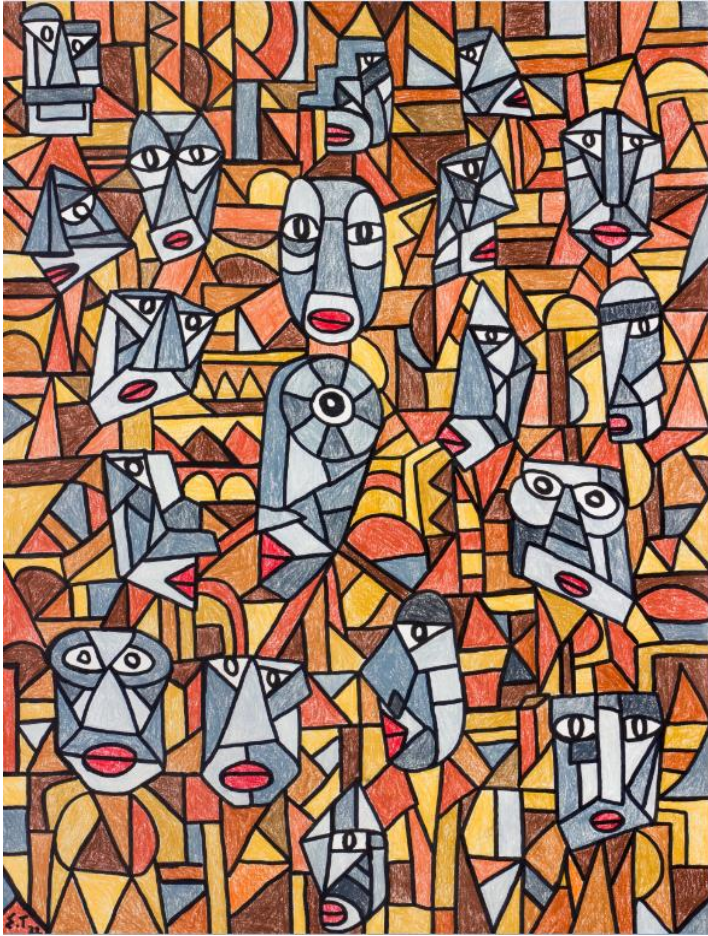
Atelier Herenplaats Rotterdam meets